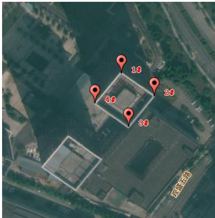
图 2-2 项目所在建筑坐标点位图

经核实，本项目选址所在区域属观澜河流域，不在深圳市基本生态控制线内，也不属于深圳市水源保护区。项目选址地理位置、与深圳市基本生态控制线位置关系见附图一、附图二，项目所在地理位置与所处流域水系关系示意图见附图七。